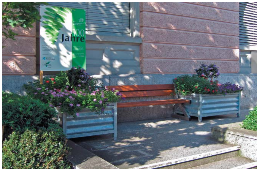
Die Aktion „Grüne Bank“ fand sehr guten Anklang bei den Banken und der Bevölkerung.

Festschrift kann unter www.gvzo.ch in der Rubrik „Downloads“ als .pdf herunter geladen werden.