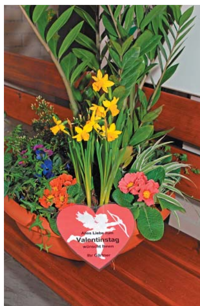
Am Valentinstag zierten Blumenschalen die „Grünen Bänke“.