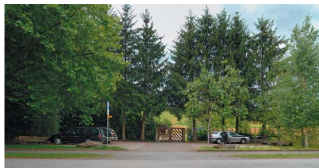
Dieser Teil des Botanischen Gartens in Grüningen wird umgestaltet

Als Abschluss dieser Aktion findet eine medienwirksame Einweihung mit Eröffnungs-Àpèro statt.