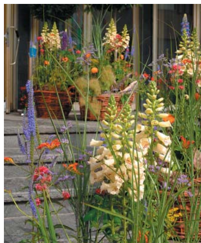
Schon vor dem Eingang war deutlich zu sehen, dass hier Gärtner feiern.