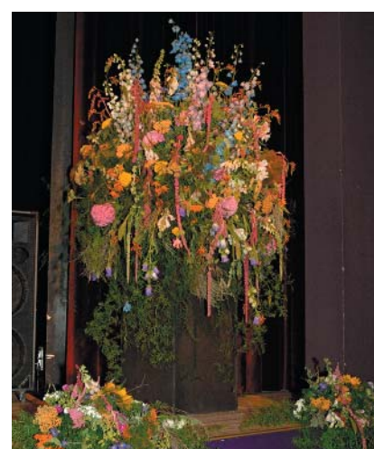
Auch der Festsaal und die Eingangshalle warteten mit üppigem Blumenschmuck auf.